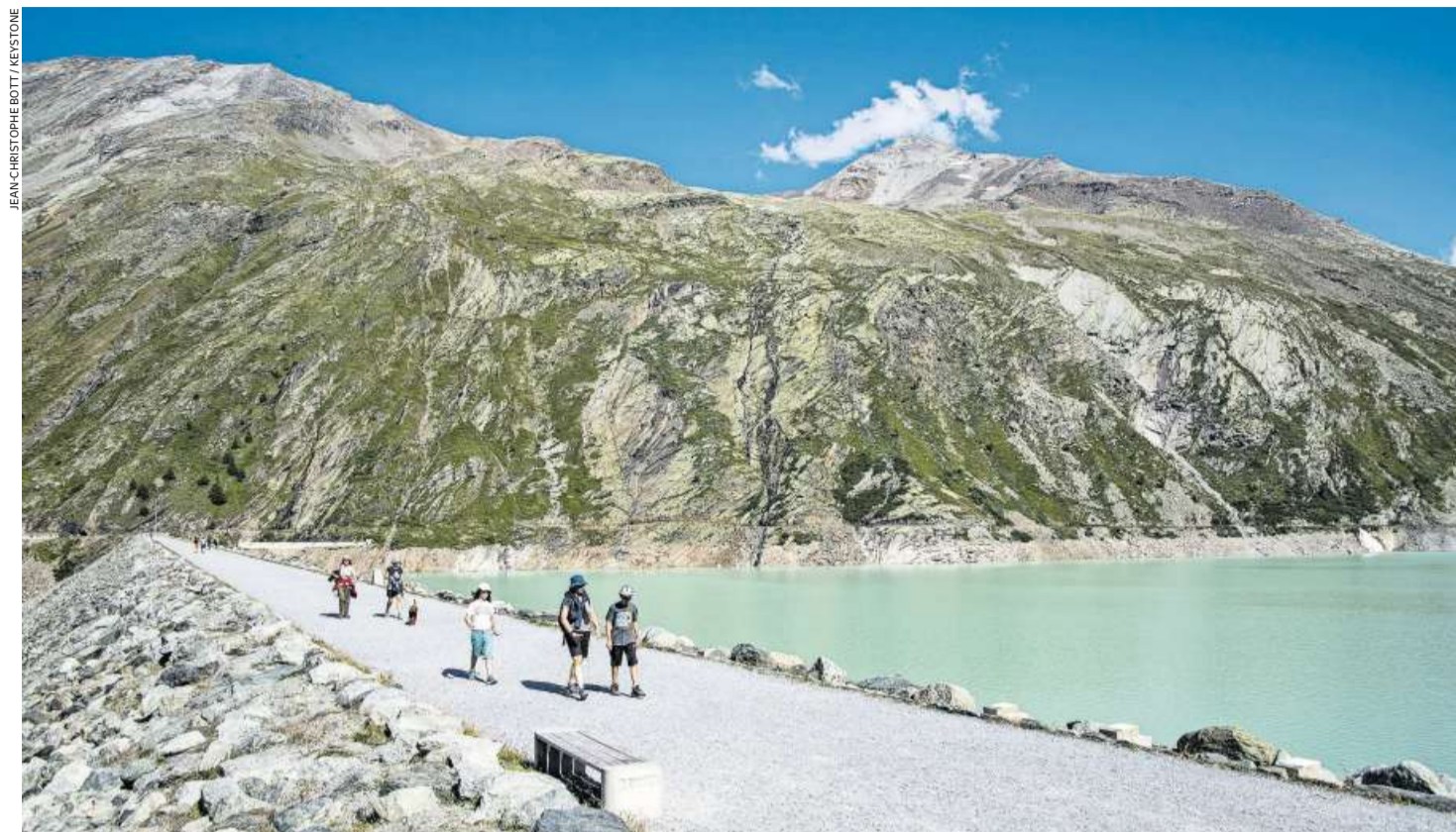
Den Schweizer Wasserkraftwerken geht es so gut wie seit langem nicht mehr: Staudamm Mattmark im Wallis. (10. August 2021)

Dank hohen Marktpreisen sprudeln bei den Kraftwerksbesitzern die Gewinne. Die Stromfirmen sehen aber keinen Grund zur Euphorie